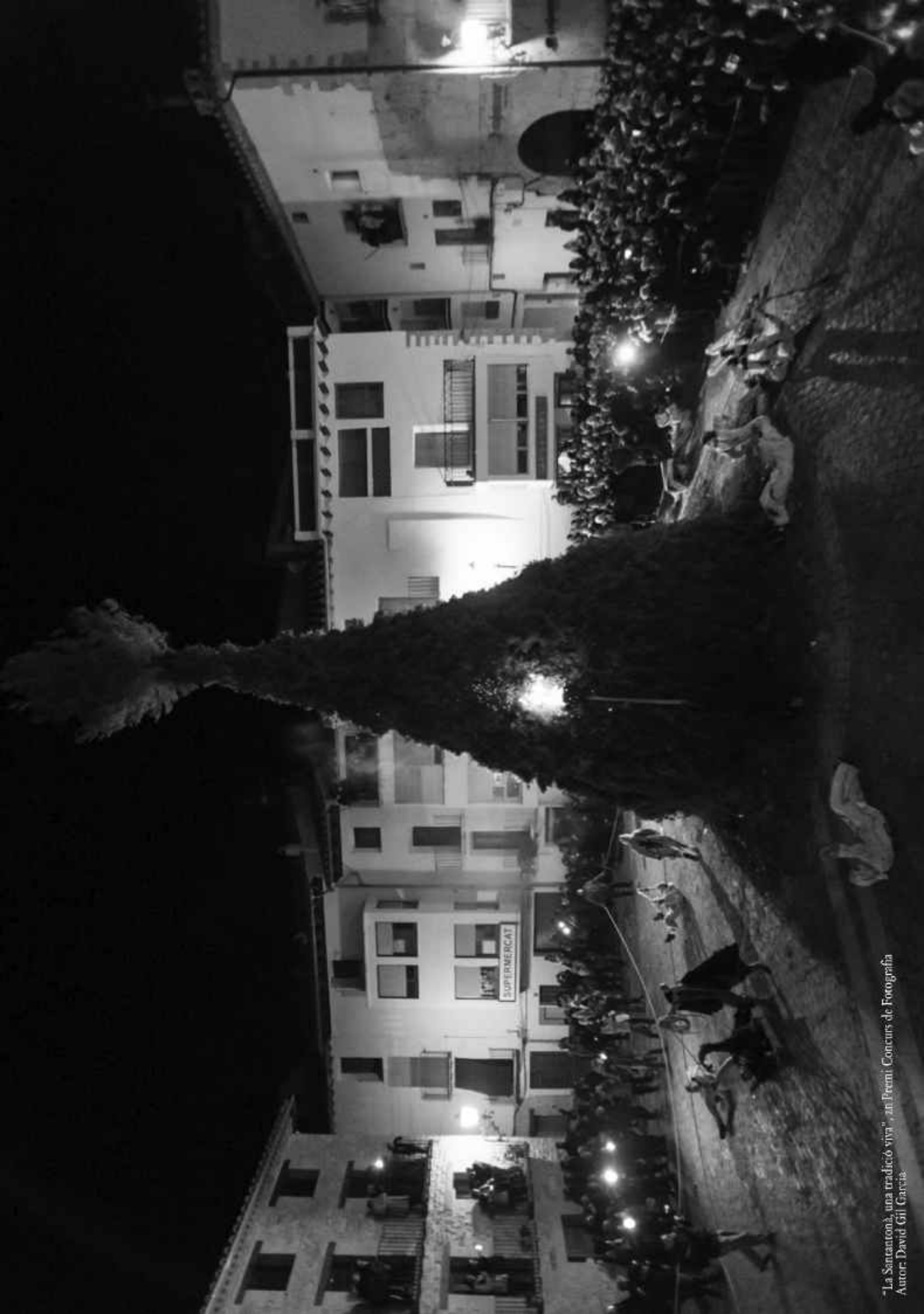
"La Santantonià, una tradició viva", al Premi Concurs de Fotografia Autor: David Gil Garcia