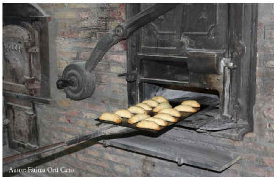
Autor: Fàtima Ortí Cano

Sempre ha sigut un goig poder compartir pastes i consells, balls, xarrades, cançons, rialles o glops de moscatell amb la resta de pastadores; però enguany el goig i l'orgull serà major, perquè sabem que tenim un paper essencial dins Sant Antoni i que, a poc a poc, formarem part també de la resta d'espais que la nostra gran festa conforma.