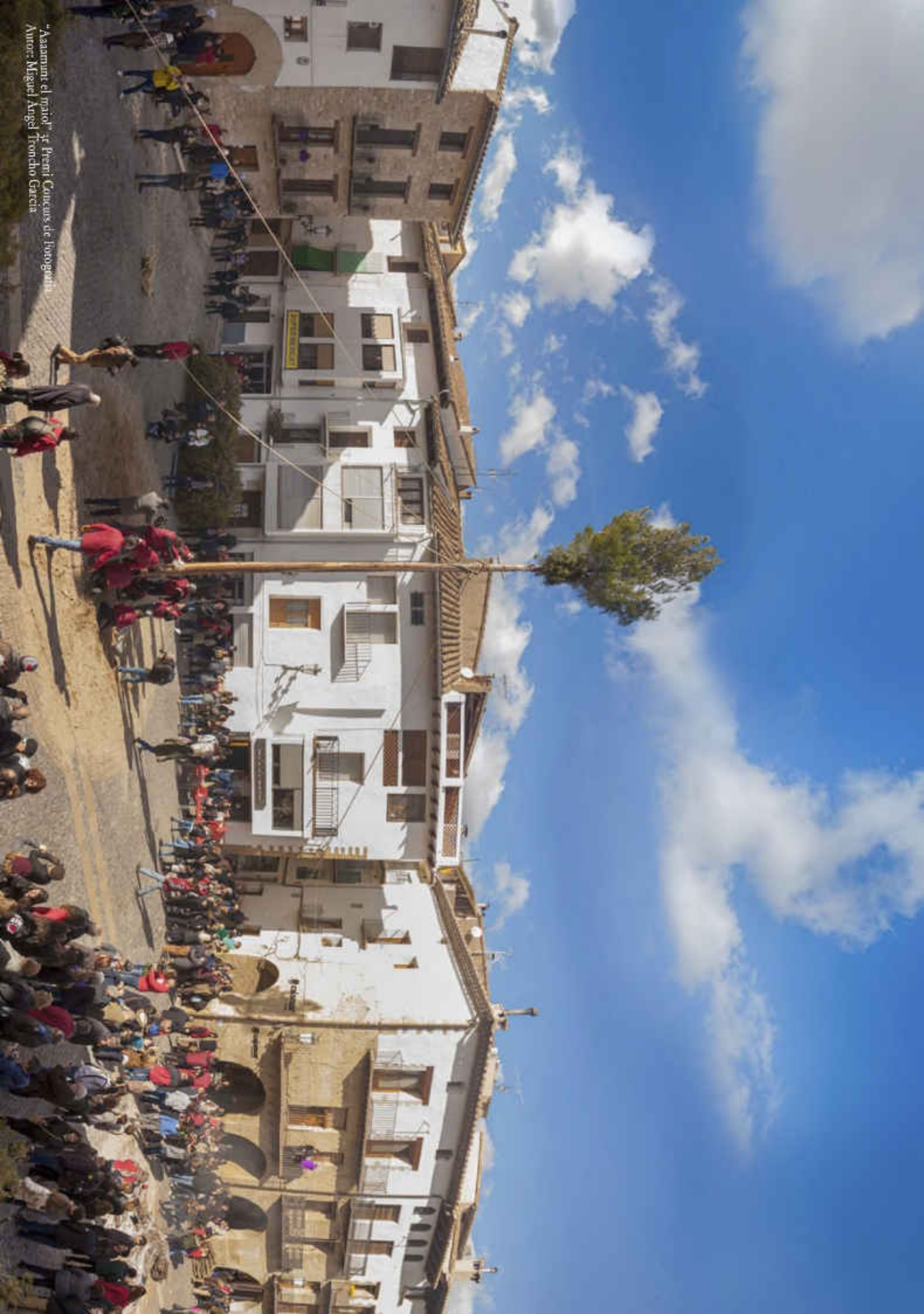
"Asamunt el pati" 41 Premi Concurs de Fotografia