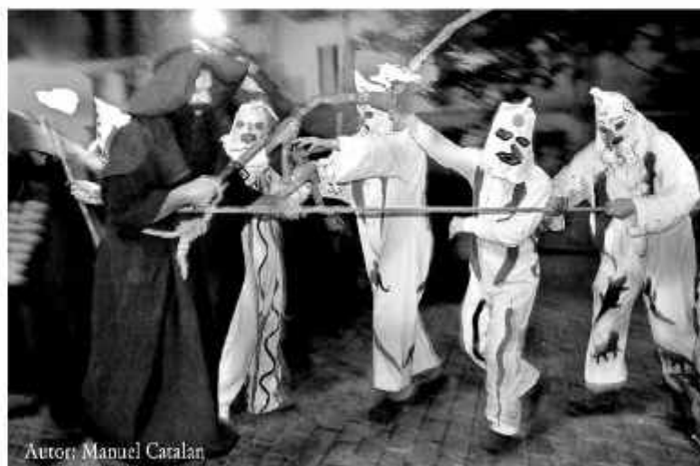
Autor: Manuel Catalan

Despeses extraordinàries i puntuals ajudaven en l'apartat de culte de la festa: adquirir un nou estendard del Sant, blanquejar l'altar de Sant Antoni, estendard per a la processó dels matxos, emmidonar els roquets, comprar fanals per a la peanya, una pedra sacra per a l'altar del Sant, les misses en sufragi dels Confreres difunts, cirials de metall, làmpada per a l'altar, llum elèctrica -1963-, impost de les cases rectorals... En l'àmbit religiós és molt significativa la nota de la visita pastoral del bisbe Manuell Moll i Salord. "Vistas las cuentas que preceden, observamos que es excesivo el gasto que se hace en cosas de carácter profano, particularmente el pasado año y en otros anteriores, y en su consecuencia disponemos que se reduzcan tales gastos, supriman lo que no sea necesario para el debido esplendor de los cultos religiosos que celebra la Cofradía". Forcall, 25 d'abril de 1948.