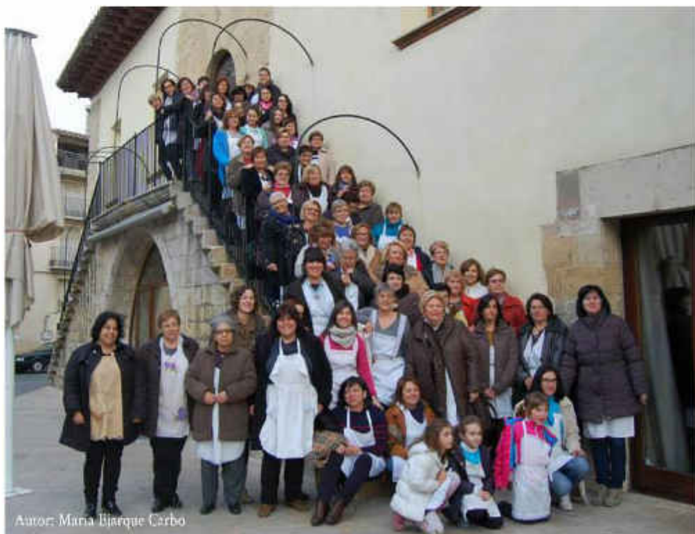
Autor: Míria Blarque Carbo

Al llarg de la història occidental, les dones han tingut un paper secundari, o fins i tot nul, en els espais culturals i festius. L'esforç i la dedicació desinteressada de tantes dones ha sigut especialment rellevant durant els dies, setmanes o mesos de preparació dels actes festius: cuinar els plats i les pastes típiques, cosir els vestits tradicionals, amanir les flors de l'església i deixar-la ben neta, fer lluir tots els carrers... Tot això per a donar pas a l'explosió de la festa, pensada i reduïda al gaudir exclusiu dels homes. Aquestes feines, malgrat ser feixugues, no rebien l'agraïment i la visibilització que es mereixien.