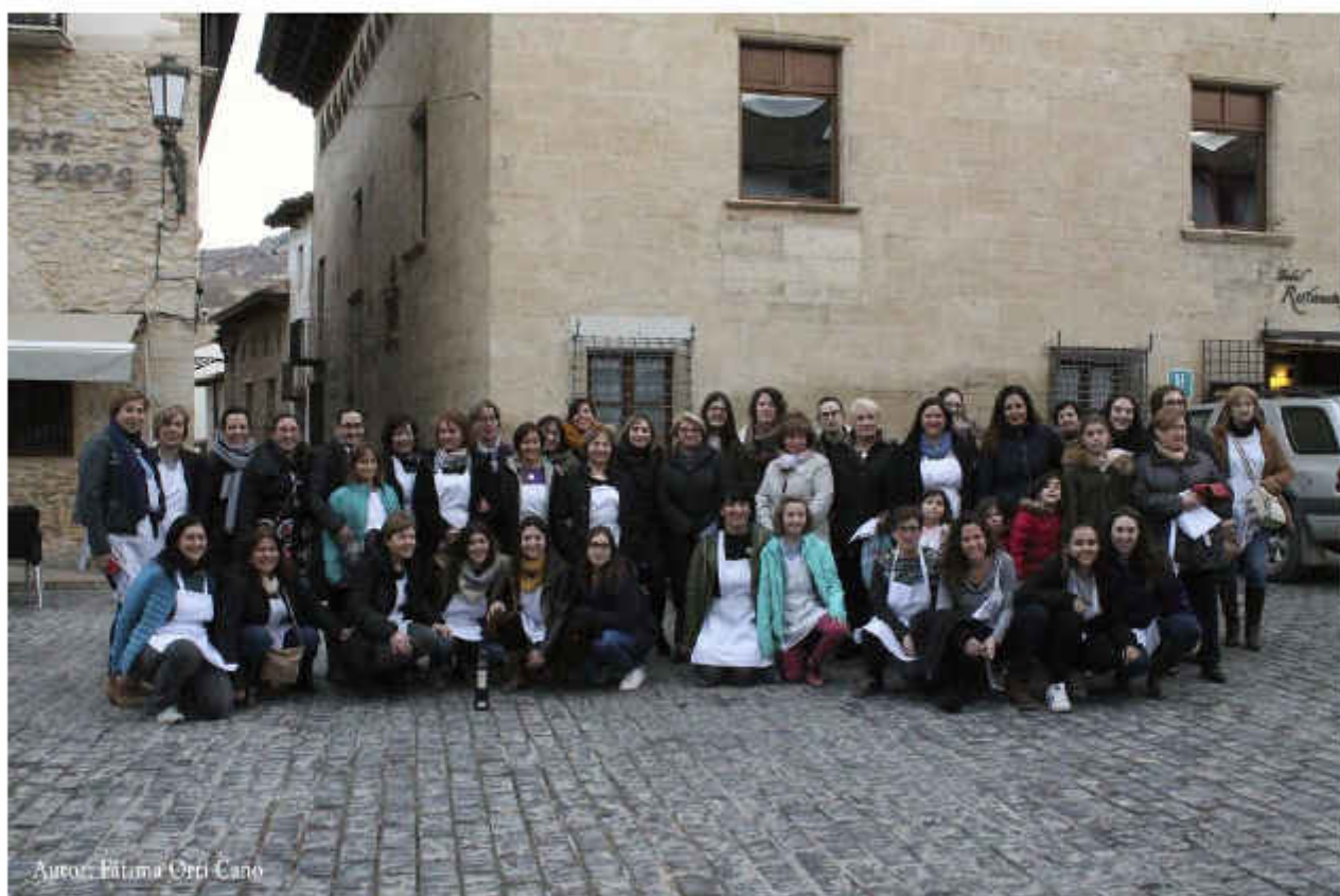
Autor: Fàtima Ortí Cano